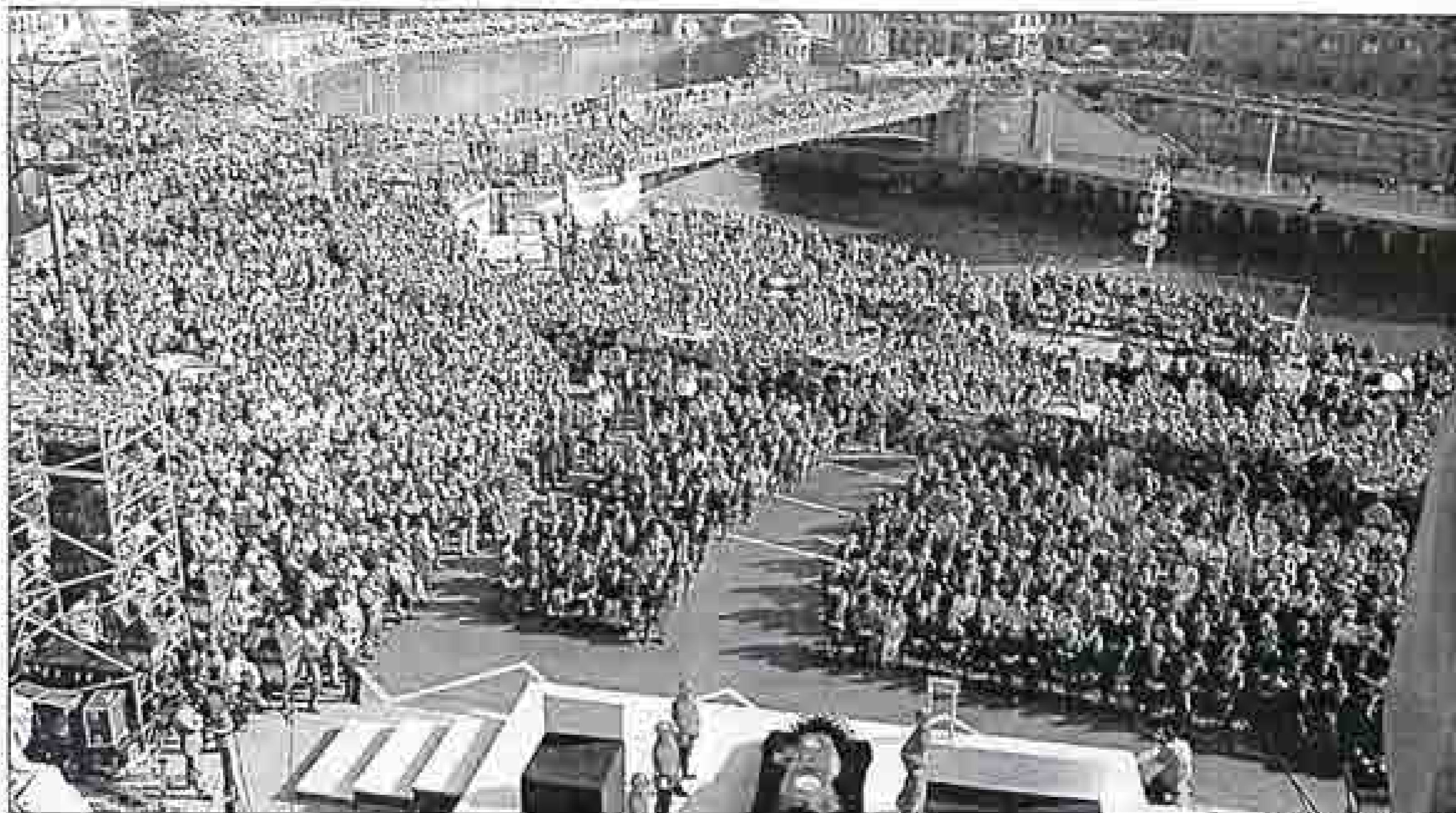
El acto de despedida se celebró en la explanada situada frente al Ayuntamiento de Bilbao.