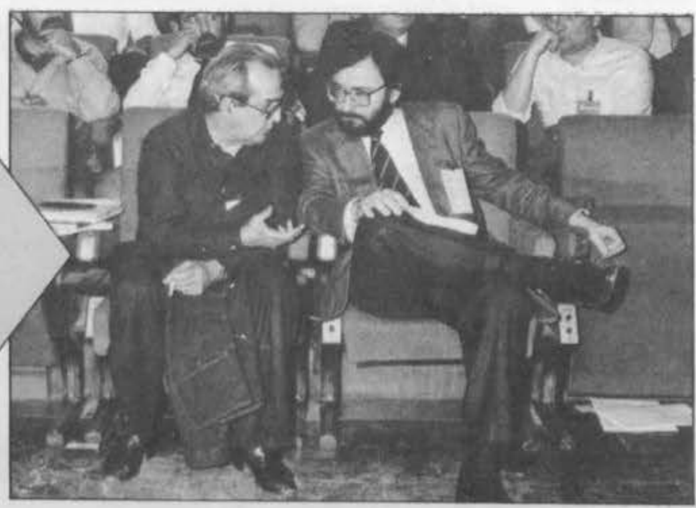
Narcis Serra y Fernando Morán dialogan en el pleno del Congreso, mientras en la tribuna los delegados exponen sus argumentos sobre el papel de España en la defensa occidental.

Fernando Morán, ministro de Asuntos Exteriores, y Narcis Serra, de Defensa, siguieron con gran interés el debate democrático, reflexivo y profundo, mantenido en nuestro XXX Congreso sobre política exterior. Quizá la característica fundamental de la asamblea socialista ha sido precisamente esa: su sentido de responsabilidad y análisis ante los problemas que acucian a la sociedad española.