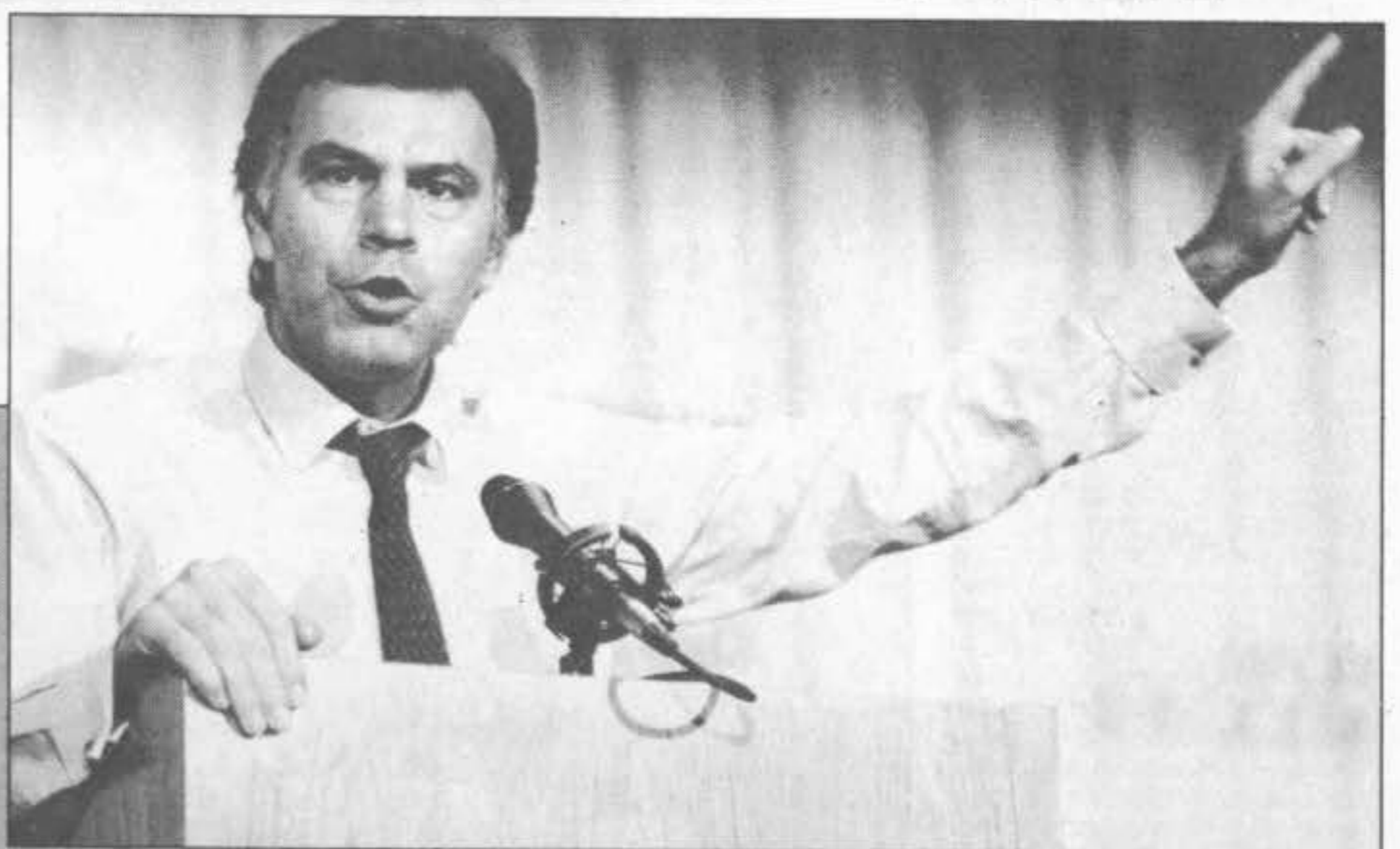
Felipe González: «España no tiene bases americanas, sino españolas con permisos para su utilización.»