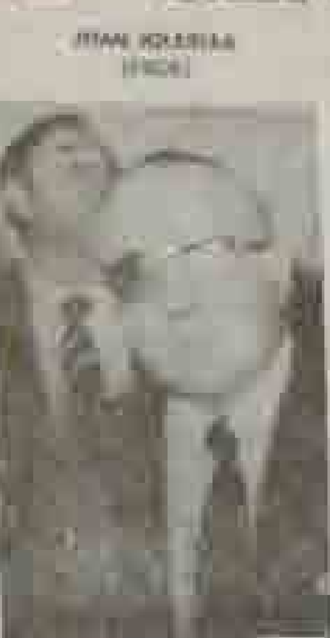
IÑAKI GABILDEA (PSOE)