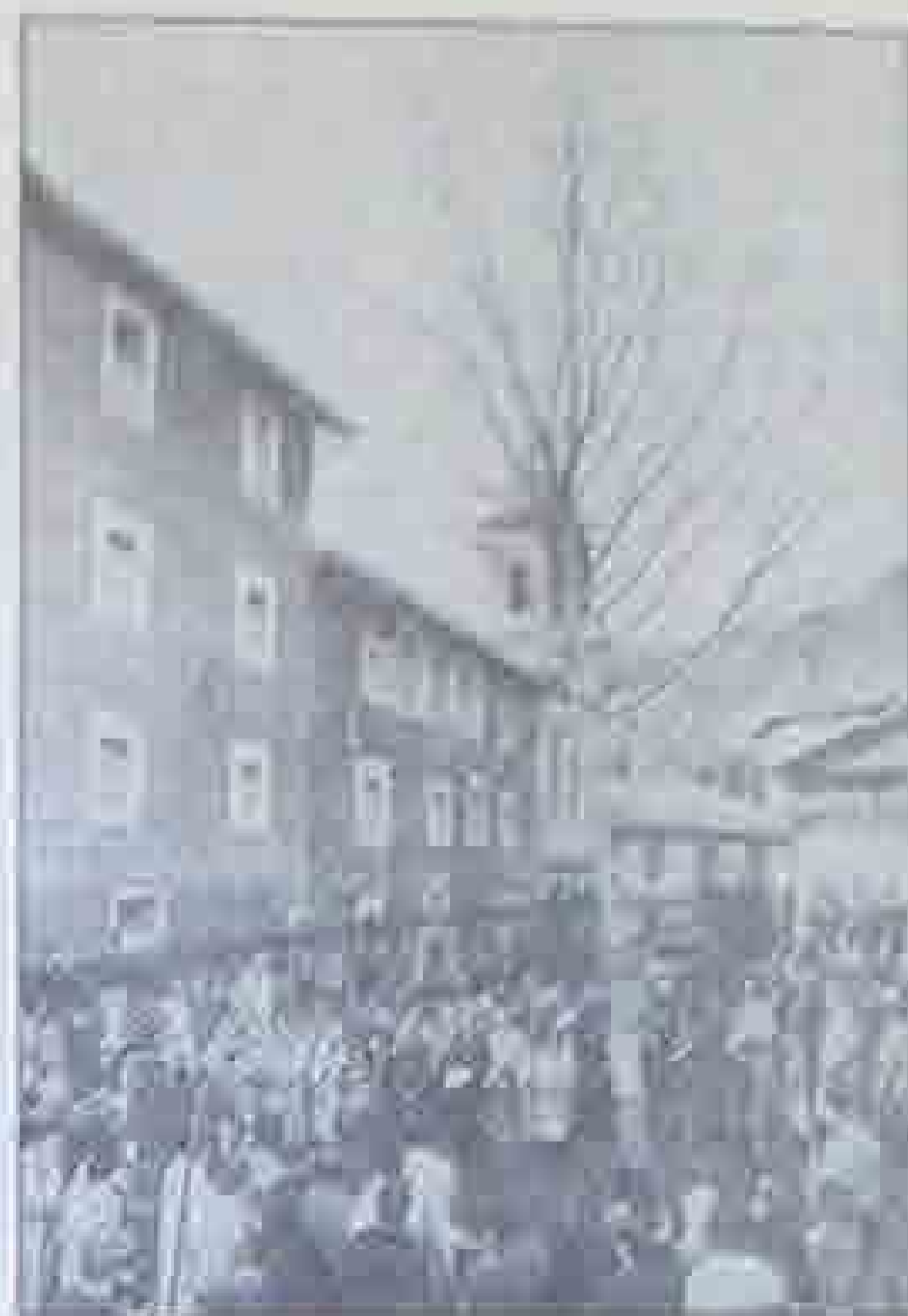
En la Casa de Juntas de Guernica, al lado del histórico árbol, tuvo lugar ayer, a primeras horas de la tarde, el acto solemne de la plantación del nuevo árbol del histórico árbol. El acto fue presidido por el presidente del CGV y el presidente de la Diputación Foral.