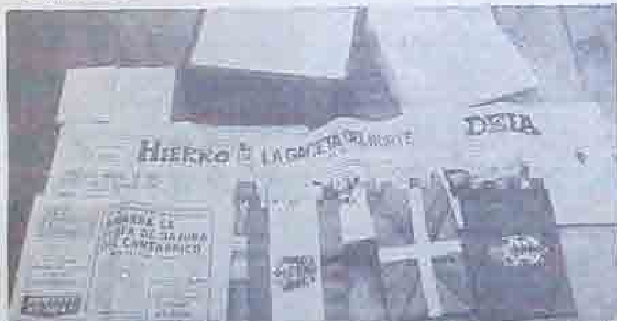
En el cofre que quedó bajo el nuevo «Arbol» se introdujeron una colección de monedas, los banderines de España, País Vasco y Señorío de Vizcaya, junto con un ejemplar del día de la fecha de los diarios de la prensa del Señorío.

Nos presentamos en el Ayuntamiento Baracaldés y nos encontramos con que no había anunciado ningún pleno, aunque al reunión de la Comisión Permanente, en cuyo orden del día no figuraba nada relacionado con asuntos trascendentales, sino de puro trámite. Nos dimos cuenta de que, momentos antes de la una de la tarde, se encontraba frente al Ayuntamiento un grupo de unas cinco personas que portaban, enrolladas, algunas pancartas. Recordamos a la celebración del supuesto pleno; pero luego nos enteramos de que éste no había sido convocado, por lo que, los incipientes manifestantes, ante su error, se marcharon, sin que pudiéramos entrevistarnos con ellos.