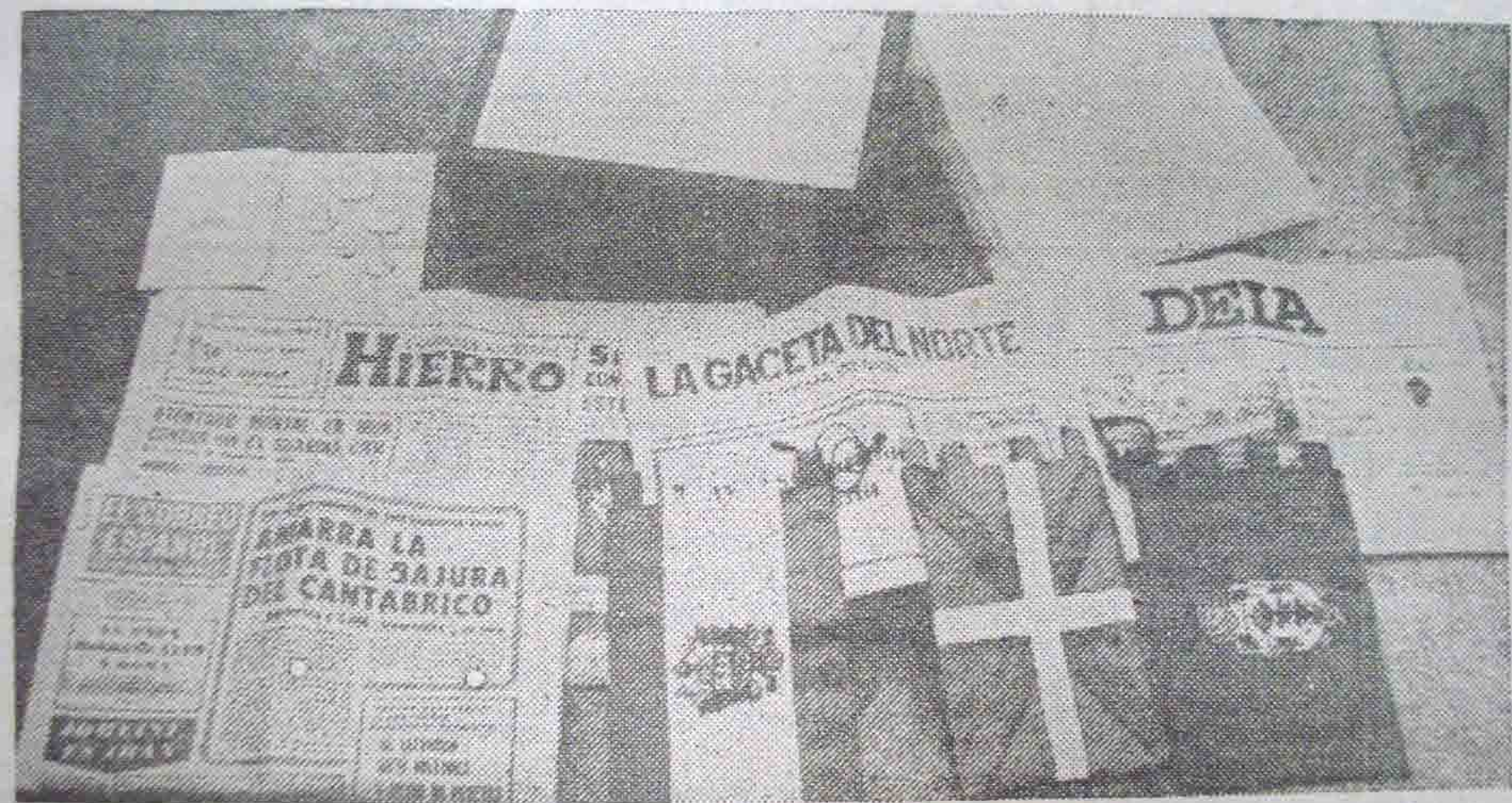
En el cofre que quedó bajo el nuevo «Arbol» se introdujeron una colección de monedas, los banderines de España, País Vasco y Señorío de Vizcaya, junto con un ejemplar del día de la fecha de los diarios de la prensa del Señorío.