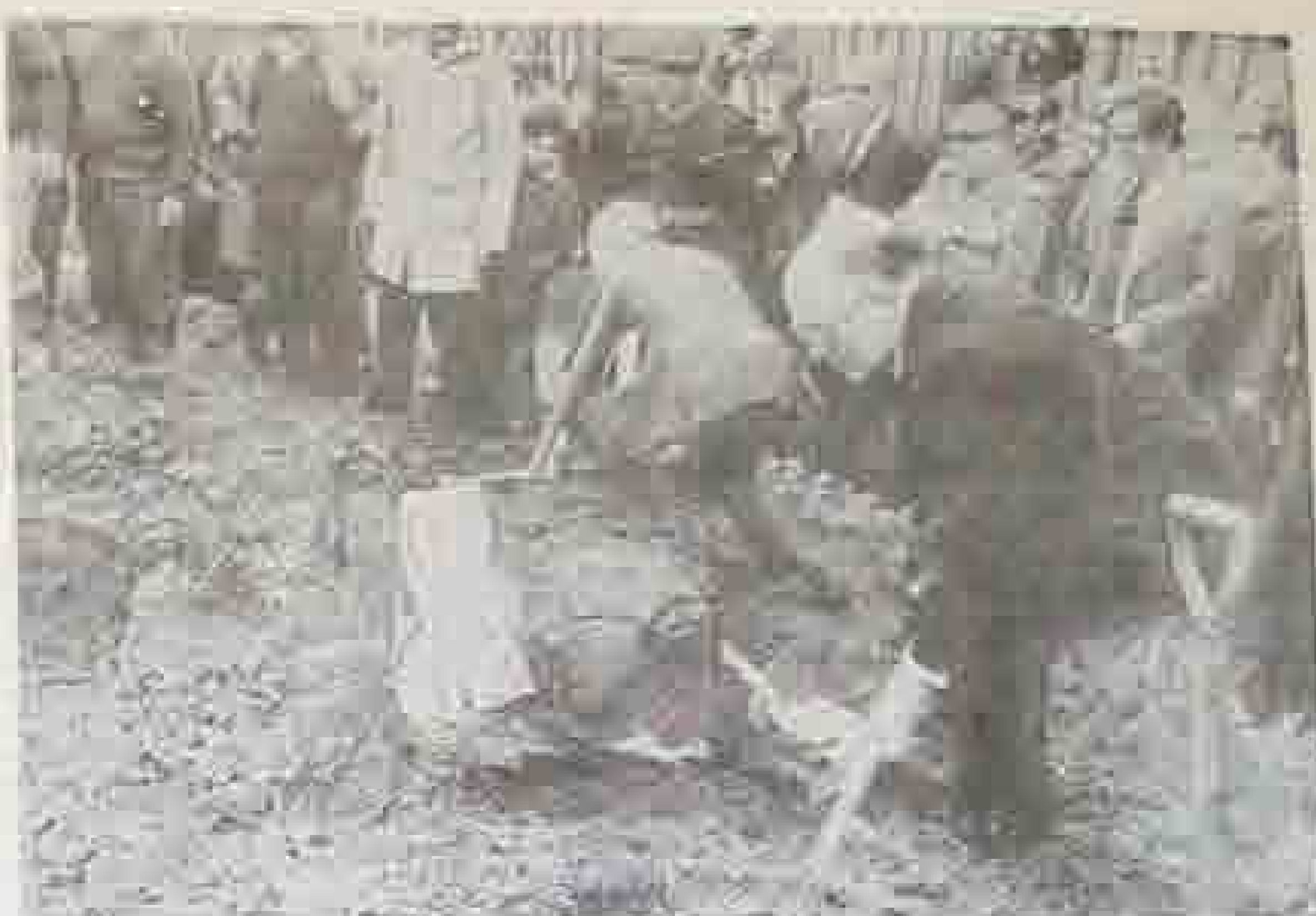
El presidente del CGV y el señor Amorrotu fueron los primeros en echar la tierra sobre el nuevo Arbol de Guernica.

Prosiguió el presidente del CGV con las siguientes palabras: «También tiene su importancia simbólica el que este acto lo estemos haciendo con la presencia casi en pleno del CGV, del organismo que intenta y lucha por devolver al País Vasco la Autonomía que asegure su identidad nacional. La nueva institución autonómica será un poco